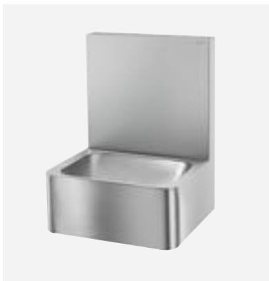
Edelstahl-Handwaschbecken Hygiene Art. DELABIE: 188000

Alle Abbildungen sind auf der Webseite www.delabie.de verfügbar, Rubrik „Presse“.