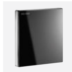
Oberfläche Glas schwarz Art. DELABIE: 430036 oder 430030