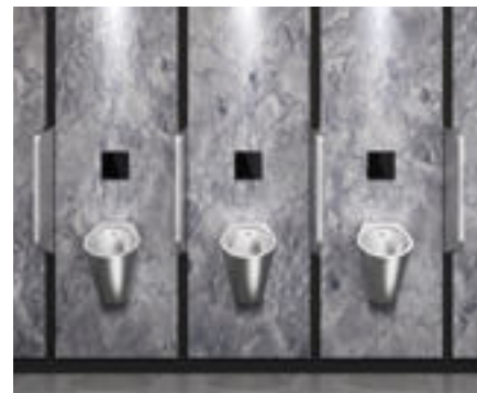
Montagebeispiel, Urinalspüler TEMPOMATIC 4 für Unterputzmontage aus Sicherheitsglas schwarz