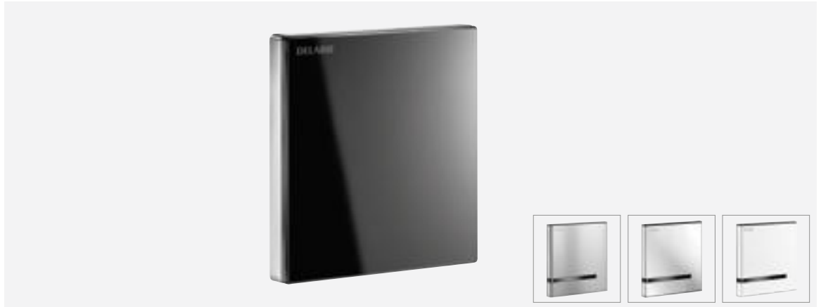
Art. DELABIE: 430036, 430006, 430016, 430026 (Batteriebetrieb) Art. DELABIE: 430030, 430000, 430010, 430020 (Netzbetrieb)

Der Urinalspüler TEMPOMATIC 4 für Unterputzmontage ist mit einem innovativen, von DELABIE patentierten Unterputzkasten versehen. Dieses neue Konzept vereint Design und Funktionalität: die Elektronik ist direkt in die Betätigungsplatte integriert.