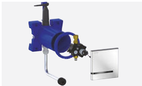
Urinalspüler TEMPOMATIC 4 für Unterputzmontage Art. DELABIE: 430PBOX + 430016 + 752430