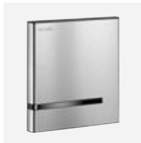
Oberfläche Edelstahl satiniert Art. DELABIE: 430006 oder 430000

Alle Abbildungen sind auf der Website delabie.de verfügbar, Rubrik „Presse“.