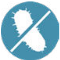
Hygiene und Begrenzung des Bakterienwachstums