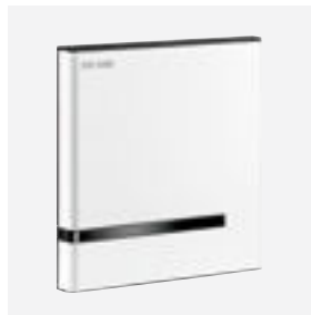
Oberfläche Edelstahl pulverbeschichtet weiß Art. DELABIE: 430026 oder 430020