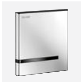
Oberfläche Edelstahl hochglanzpoliert Art. DELABIE: 430016 oder 430010